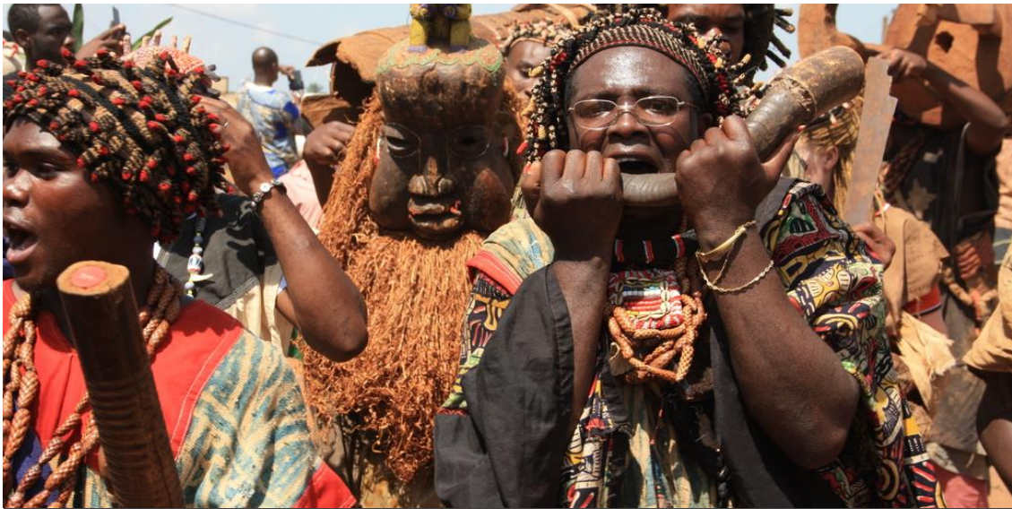
Unesco Nguon Festival