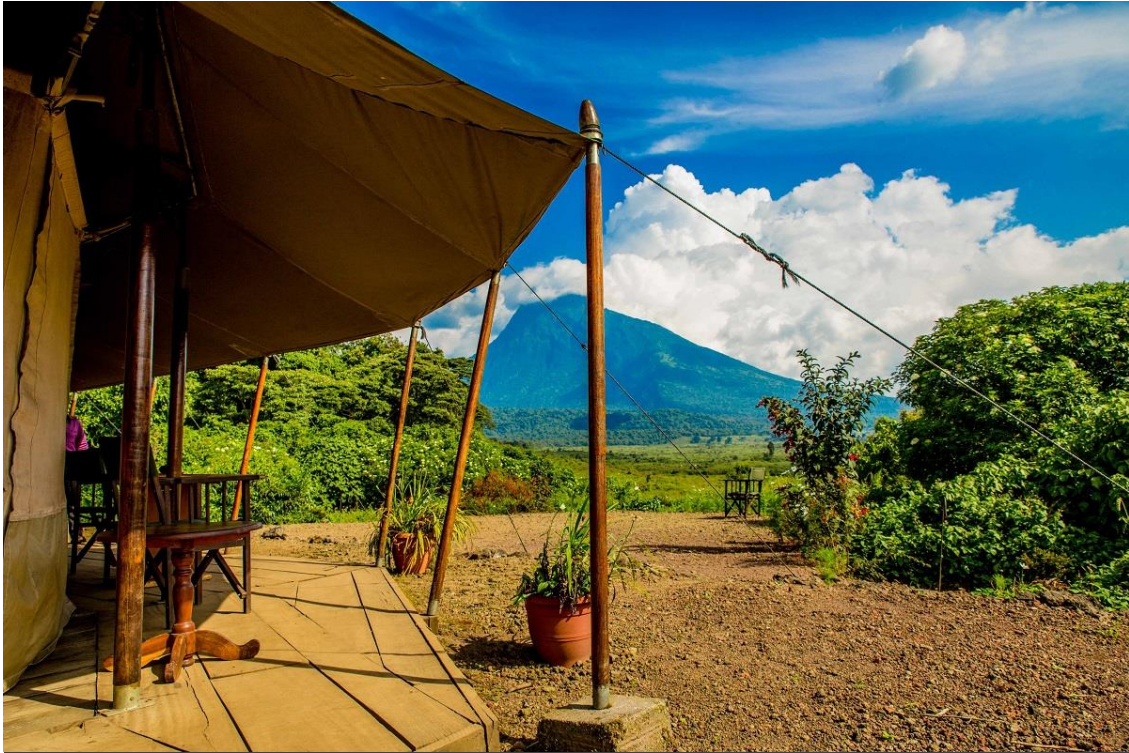
Lodge Tchegera en vulkaan Nyiragongo