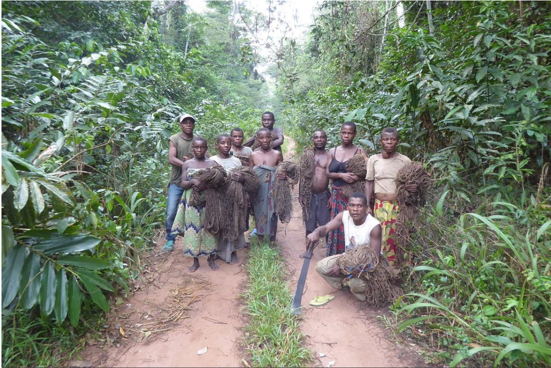
Pygmeeën in het Tropsich regenwoud van Kameroen.