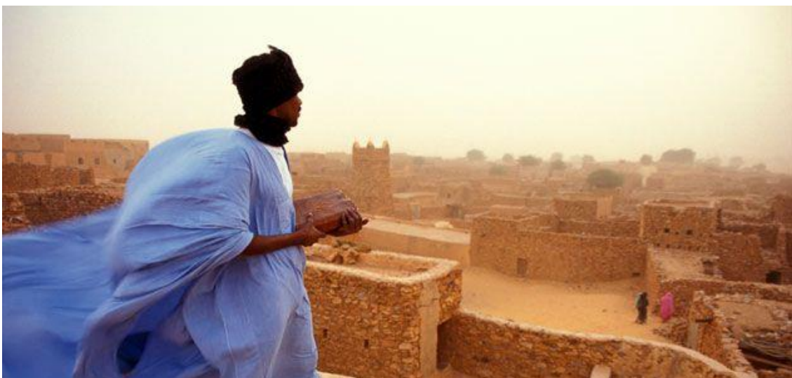
Chinguetti - verzonken woestijnstad in Mauritanië

Het gaat hier om een kort verblijf, werkelijk om zich te herbronnen. De gloed, de sterren, de bloemen in de woestijn zijn van een ongehoorde pracht en dringt diep tot uw bewondering en verwondering door.