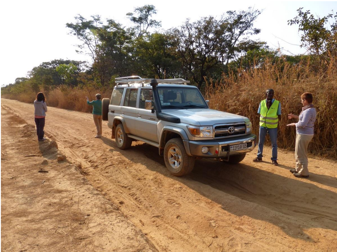
De 4x4 om de RD Congo te bezoeken in de formule Fly & Drive